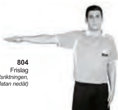
804 Frislag (armen vågrätt i fördelsriktningen, handflatan nedåt)