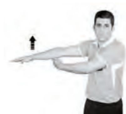
903 Lyftning av klubba (handflatan nedåt)