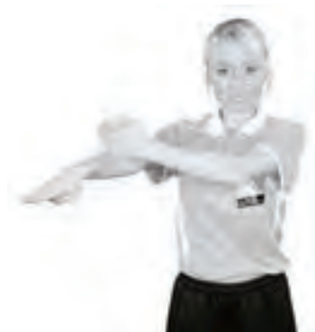
901 Otillåtet slag (ett slag med handen)