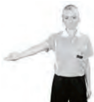
805 Fördel (armen i fördelsriktningen, handflatan snett uppåt in mot planen)