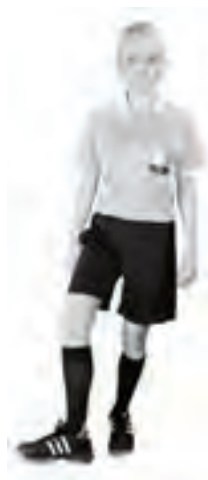
912 Otillåten spark (foten i vrishöjd, vriden utåt)