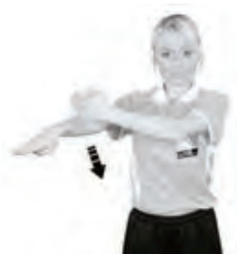
902 Låsning av klubba (handflatan nedåt)